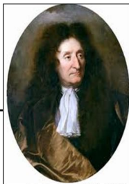
Jean de La Fontaine (1621-1695)

Cette fable montre qu'en toute affaire il faut se garder de la négligence, si l'on veut éviter le chagrin et le danger.