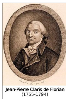
Jean-Pierre Claris de Florian (1755-1794)

Il a réécrit des fables grecques et latines, mais a aussi inventé les siennes.